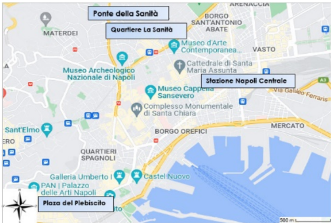
FIGURA 1. Mapa de Nápoles

Los sitios atractivos para el turismo en el barrio son las Catacumbas de San Gennaro y la Iglesia Madre del Buon Consiglio (o de San Genaro), primer hito si se desciende desde Capodimonte; la Iglesia de Santa María de la Vitta al oeste si se baja por el ascensor; y más allá el Cementerio delle Fontanelle; la plaza al este, las Catacumbas de San Gaudioso junto a la Iglesia de Santa María della Sanità y más allá la Basílica de San Severo.