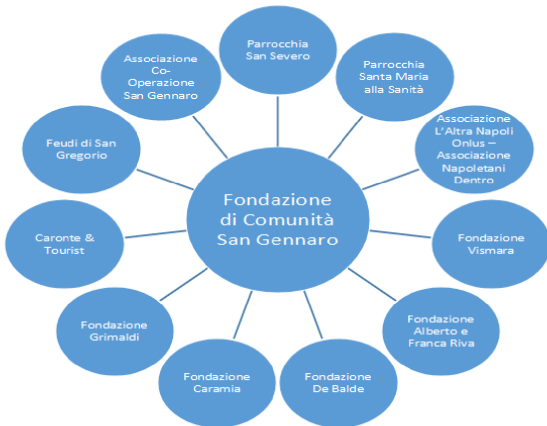
FIGURA 5 Socios Fundadores de Fondazione di Comunità San Gennaro que figuran en la Página oficial

De a poco se fue conformando un modelo de financiamiento vía proyectos públicos o mediante patrocinios privados, gestionados por las diversas asociaciones que, en 2014, como se analiza más abajo, fueron integradas en la Fondazione di Comunità San Gennaro. La prensa habló de desacuerdo con el Vaticano, principalmente respecto al porcentaje de ingresos económicos de las catacumbas que exigía la Pontificia Comisión de Arqueología Sacra ya que el mencionado patrimonio arqueológico es propiedad del Vaticano (Cernuzio, 2018).