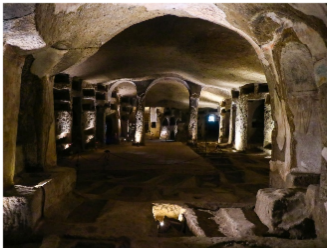
FIGURA 2. Catacumbas de San Gennaro

El proyecto bajo análisis se basa en la promoción turística del patrimonio cultural del barrio, hay para visitar principalmente las Catacumbas de San Gennaro, un cementerio de los siglos II y III d.C, y que con los años se convirtió en el más grande de todo el sur de Italia y un destino de peregrinación importante (Lamperti, 2019). Allí se hallan restos de Sant' Agrippina, la primera patrona de Nápoles y el lugar, como otros de la ciudad, fue usado durante la Segunda Guerra Mundial como refugio (Klaos, 2019).