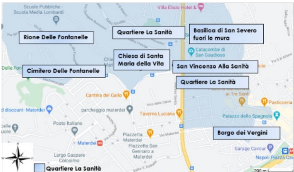
FIGURA 4 Atractivos del Rione Sanità

También como ya se dijo, se pueden visitar las Catacumbas de San Gaudioso, de San Severo y el Cementerio delle Fontanelle. En las adyacencias se encuentra el Palacio Español y el palacio San Félix construidos en 1700 y la Basílica de Santa Maria della Sanità, construida algo después. En el siglo XVIII sus calles se convirtieron en la ruta de la familia real desde el centro de la ciudad hasta el Palacio de Capodimonte (NapoliLike, 2021; Altra terra di lavoro, 2020). En el 1800 se construyó el puente, el mismo sufrió un intento de destrucción por parte de los alemanes derrotados en los Cuatro Días de Nápoles de 1943, pero un grupo de partisanos salvó el puente de la destrucción, transformándolo en símbolo de la resistencia de la Segunda Guerra Mundial (Clemente, 2015). En la Figura 3 pueden verse los principales atractivos.