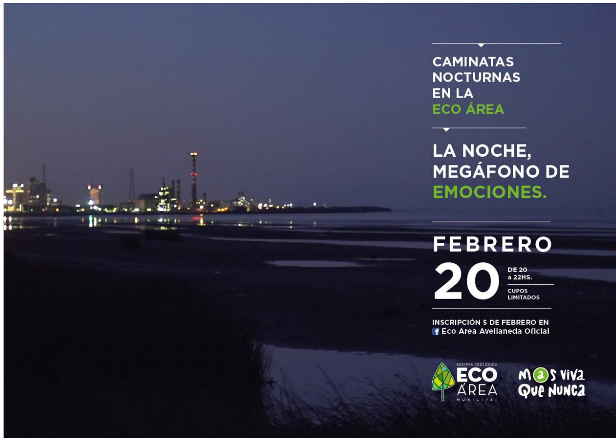
FIGURA 2 Vista a la zona de Puerto Madero desde la Eco Área Avellaneda