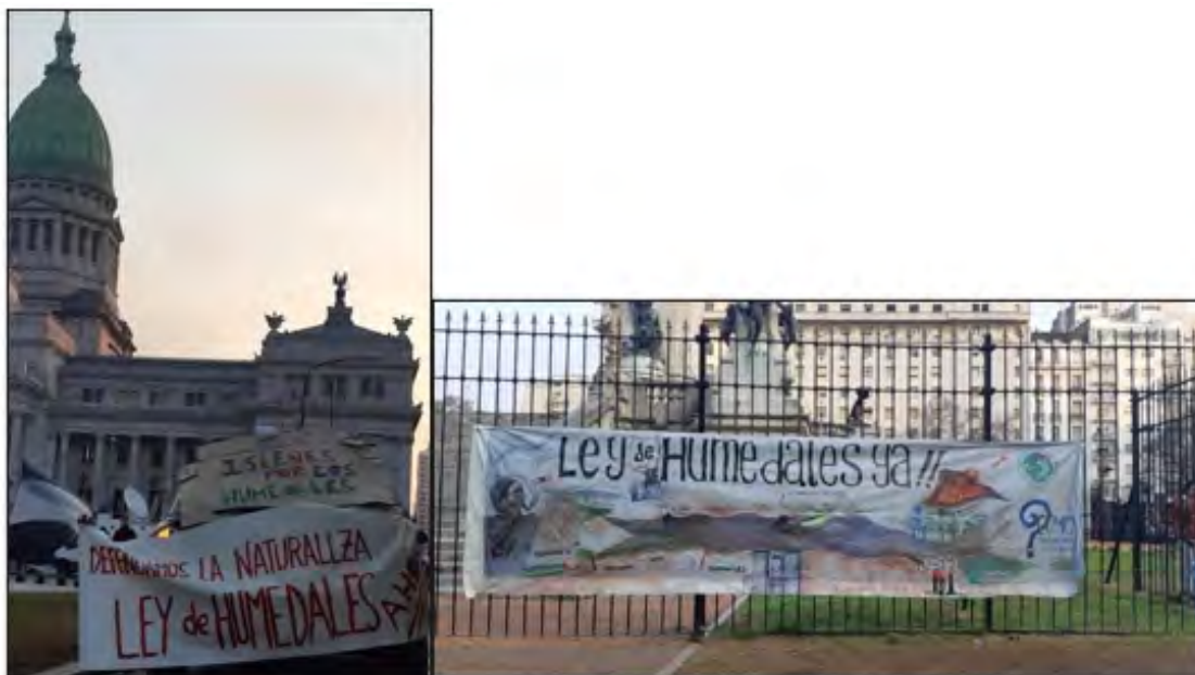
FIGURA 3 Manifestación frente al Congreso de la Nación