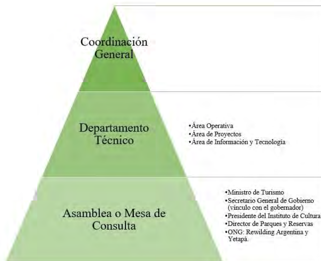
FIGURA 2 Organigrama del Comité Iberá

La Figura 2 deja en evidencia la interesante conformación del Comité Iberá integrado por un conjunto de actores que, además de ser interdisciplinarios, pertenecen a distintas instituciones. Como explicara la coordinadora del Departamento Técnico en una entrevista en el año 2020, “no solo tenés la pata del ejecutivo provincial, sino que también tenés el Senado Provincial y a las ONG que están vinculadas al Iberá, pero que no forman parte del gobierno.” Asimismo, explicó que el coordinador general también es presidente de la Comisión de Ecología y Medio Ambiente de la Cámara de Senadores.