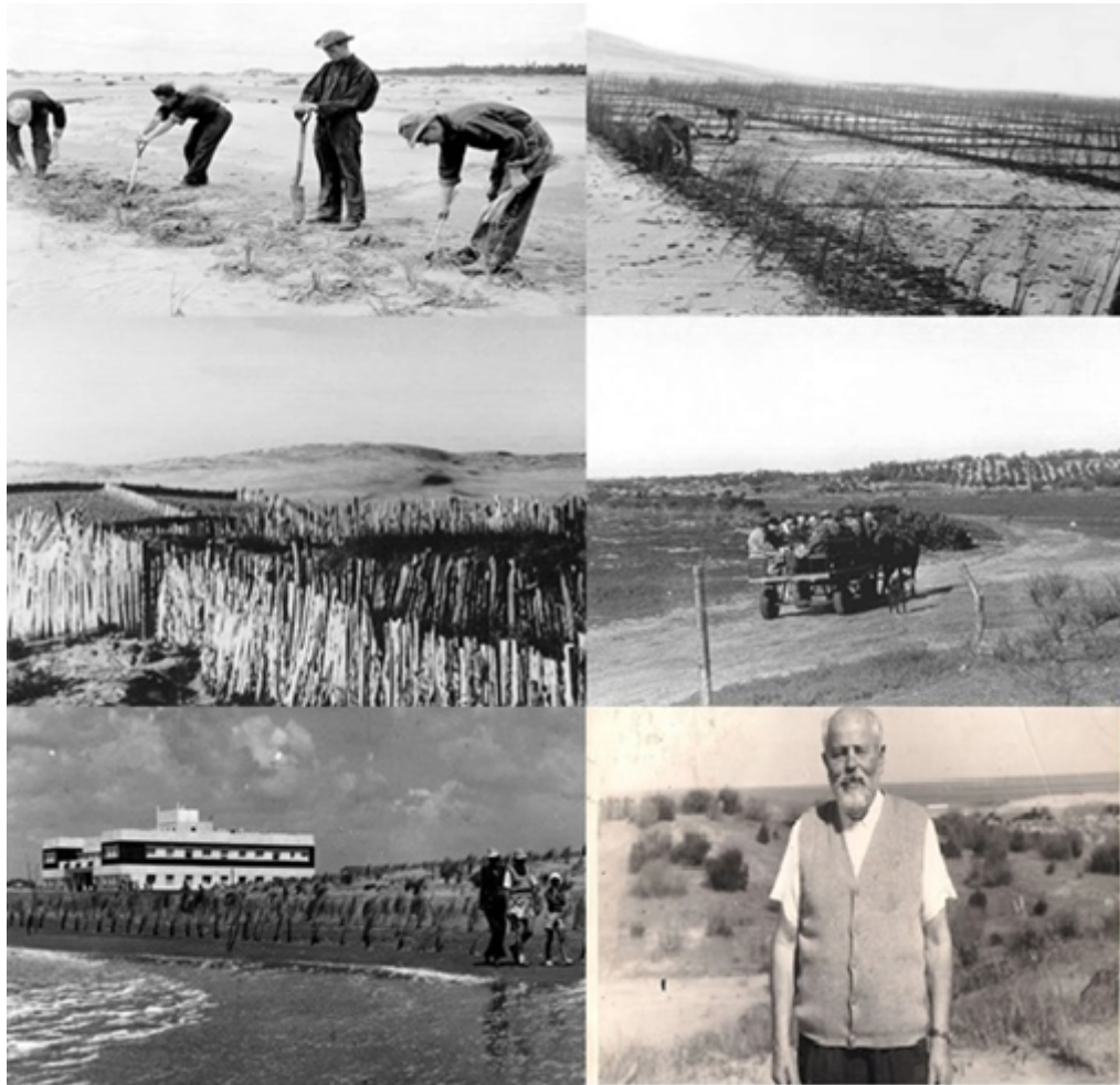
FIGURA N.º 3 Fijación de médanos en el actual Partido de Pinamar y Villa Gesell

Las imágenes pertenecen a las tareas de fijación de médanos llevadas adelante en un sector del área objeto de estudio. Sobre el margen derecho inferior una fotografía de uno de los pioneros de la región, Carlos Idaho Gesell. Fuente: https://www.voyagesell.com.ar/ y https://www.pinamarturismo.com.ar/