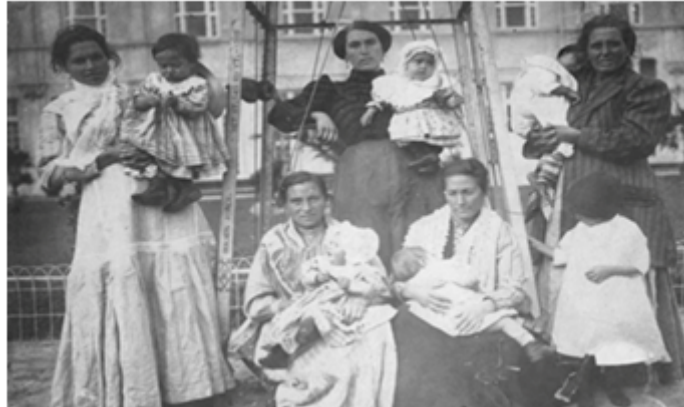
FIGURA 2 Hotel de Inmigrantes, Buenos Aires, 1912