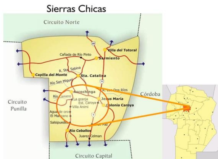
Figura 2 Área de Sierras Chicas y destacado: La Granja-Ascochinga-Villa Ani-Mí