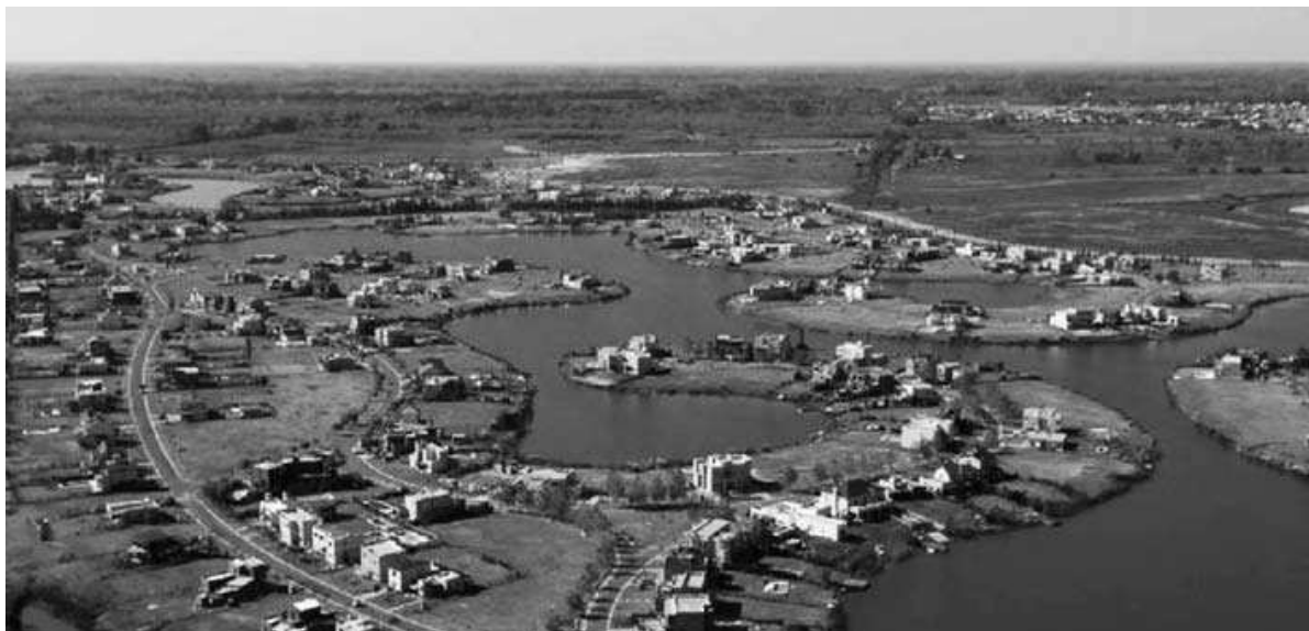
Figura 2: Vista aérea barrio Santa Catalina del Complejo Villanueva. Partido de Tigre

El papel protagónico en la puesta en escena de las UCP, que aparece en los últimos 15 años como una oferta diferenciada del mercado tradicional de urbanizaciones cerradas –UC–, está representado por los desarrolladores privados y la imagen del producto que promocionan: el nuevo producto urbanístico sigue ofreciendo, al igual que las UC, seguridad y contacto sólo con personas que comparten un mismo estilo de vida. Pero su mayor atractivo está en el paisaje banal asociado al agua, que se recrea en distintas partes del mundo y arrasa con la identidad del lugar. Los nuevos cuerpos de agua confinados que se generan representan un valor agregado, ya que pueden ser usados para acceder por vía acuática a cada parcela en forma individual o para practicar deportes náuticos o de pesca; o simplemente, como parte del paisaje –natural o antropizado (Figura 2).