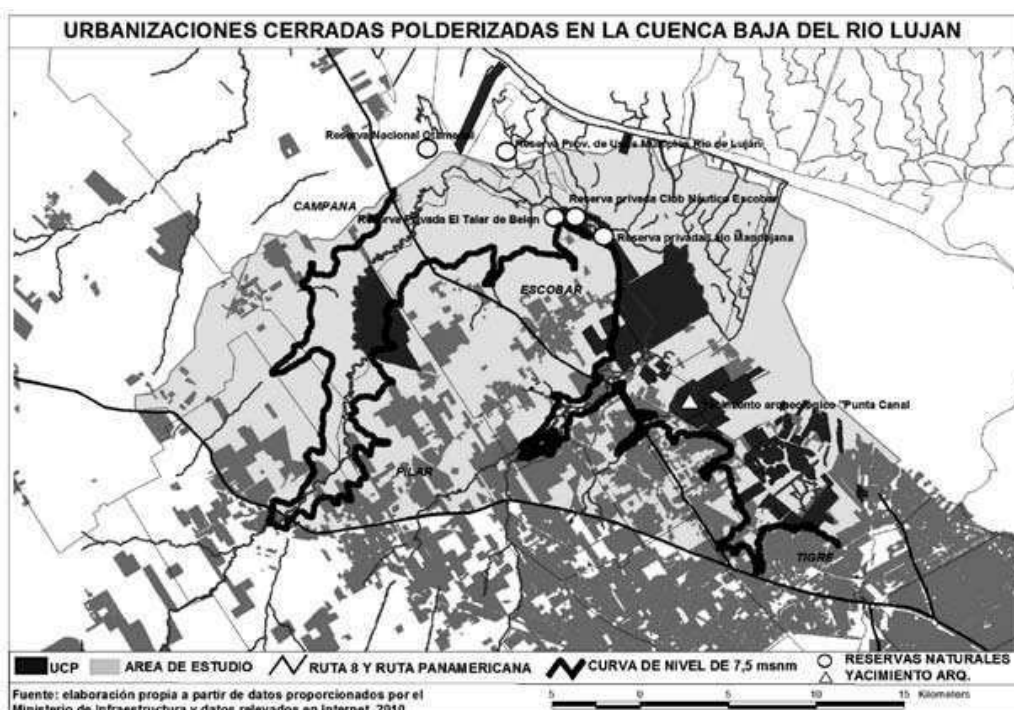
Figura 1: Localización del área de estudio, UCP, reservas naturales y yacimiento arqueológico

Para terminar de configurar el área de estudio, y consecuentemente definir el universo de UCP, se consideró la curva de nivel de 7,5 msnm, ya que se analizaron sólo aquellos emprendimientos que están por debajo de esa cota, aunque sólo fuera una pequeña porción del predio 5 . Esta cota fue establecida como crítica tomando como parámetros eventos de inundación recientes que afectaron a distintas urbanizaciones, en coincidencia, a su vez, con lo señalado por un investigador de SEGEMAR 6 (Figura 1).