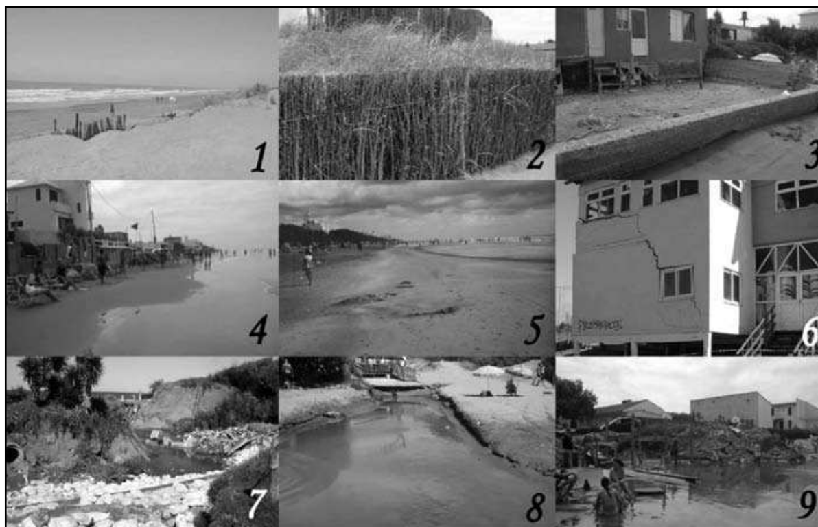
Figura 3: Fotografías que reflejan distintas situaciones relacionadas con la erosión costera en Mar del Tuyú

1) Zona de anteduna sin forestar 2) Sistema de enquinchado para regenerar la duna 3) Construcción sobre la anteduna, lindante con la playa 4) Zona de construcciones sin anteduna 5) Zona de médanos forestados 6) Grieta en pared de balneario provocada por el socavamiento de su base durante una tormenta 7) Soluciones “blandas” a la erosión: bolsas de arena 8) Canaleta provocada por la desembocadura de una calle a la playa 9) Construcción de una bajada de playa.