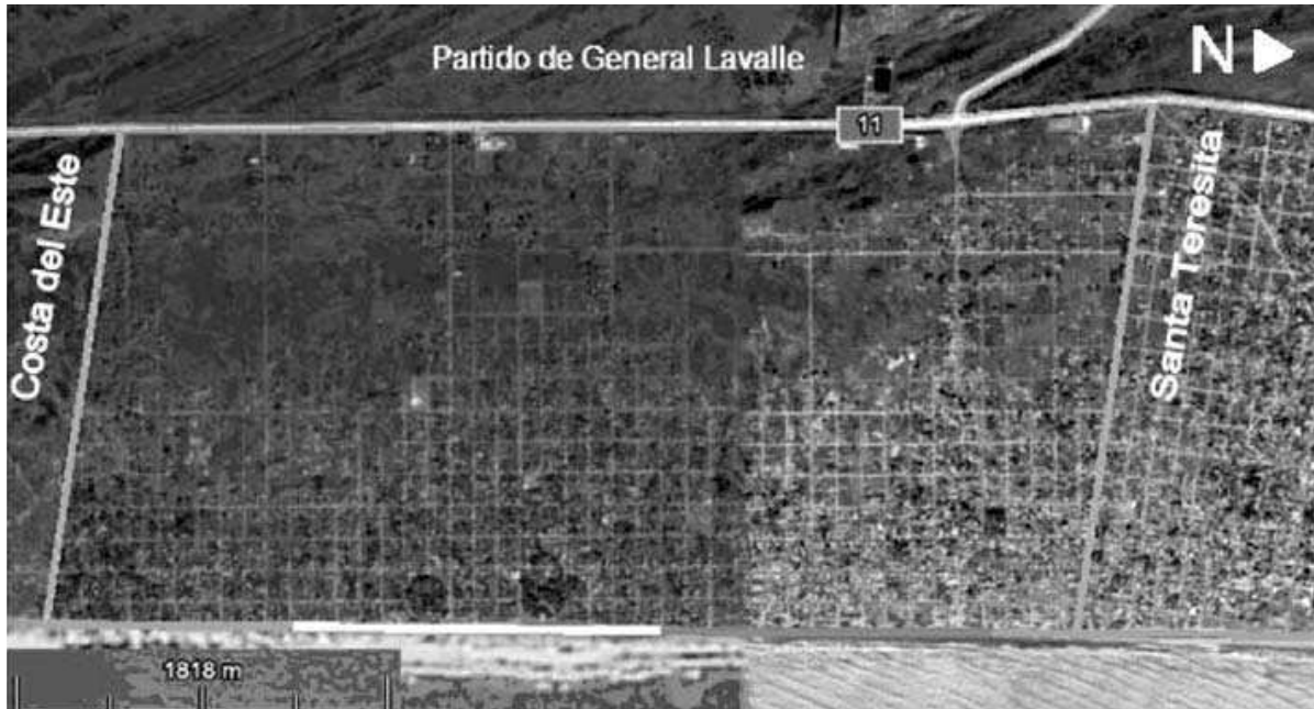
Figura 2. Imagen satelital de la localidad de Mar del Tuyú y situación de la anteduna

Imágen satelital de la localidad de Mar del Tuyú Identificación de situación de la anteduna