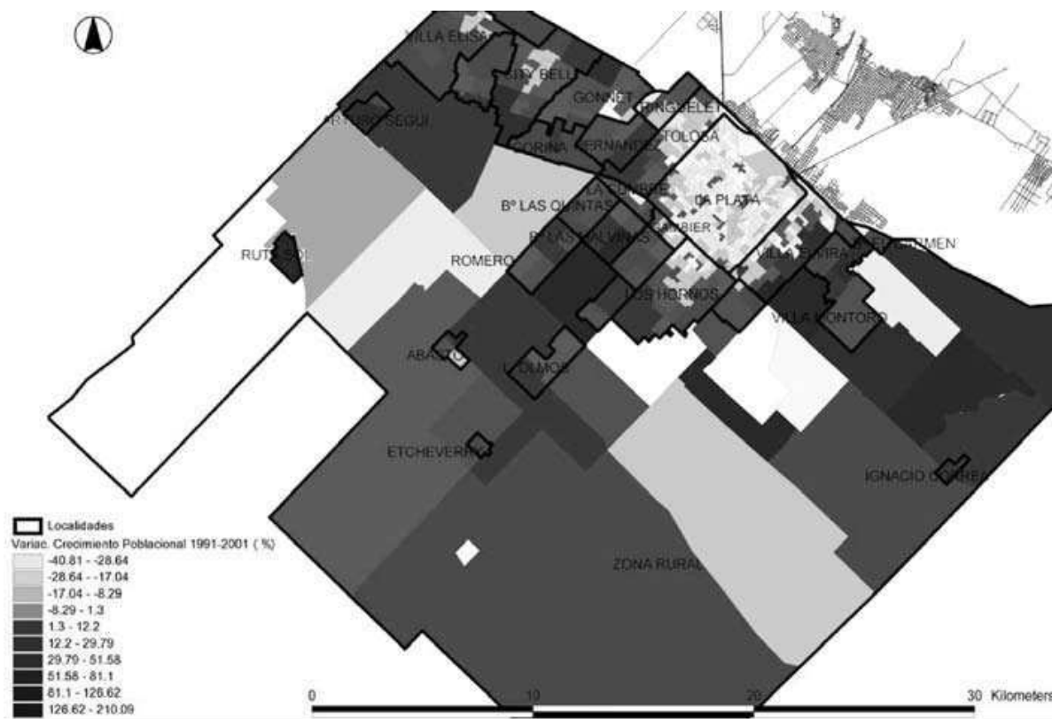
Figura 3. Crecimiento poblacional por sectores del Partido de La Plata. Período 1991-2001

Fuente: Elaboración Propia mediante SIG-Arc View 3.1