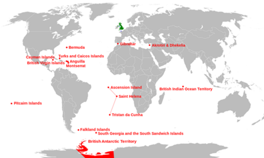
FIGURA 3 Territorios Británicos de Ultramar