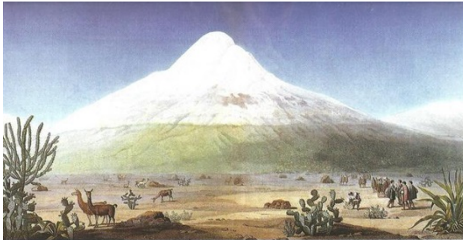
LÁMINA XXV El Chimborazo, visto desde la meseta de Tapia

Vistas de las cordilleras y monumentos de los pueblos indígenas de América. Fuente: Alexander von Humboldt (2012)